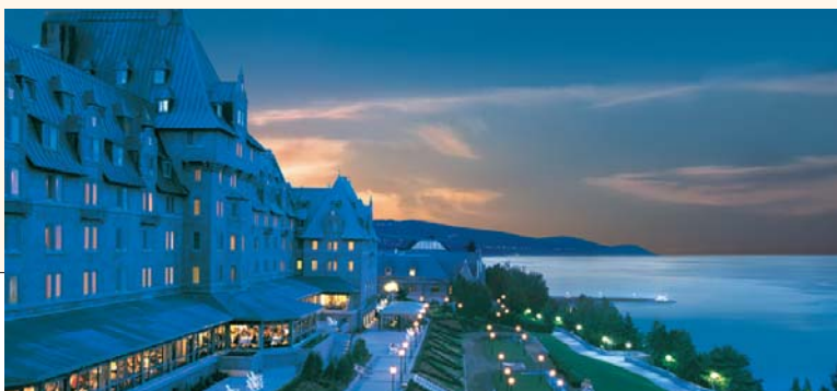
Casino de Charlevoix et hôtel Fairmont Le Manoir Richelieu