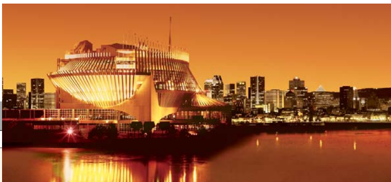
Casino de Montréal