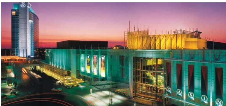
Complexe Lac-Leamy : Casino et hôtel Hilton