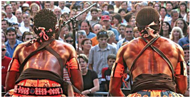
Festival international des rythmes du monde de Saguenay

La commandite de plus d'une centaine d'événements populaires et rassembleurs à travers le Québec dans le cadre des Rendez-vous Loto-Québec et du programme Sorties signées Casino , sélectionnés en fonction de leurs retombées dans la communauté et de leur pouvoir d'attraction touristique.