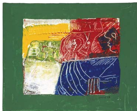
Gilles Carle, Île verte , 1997, acrylique sur toile