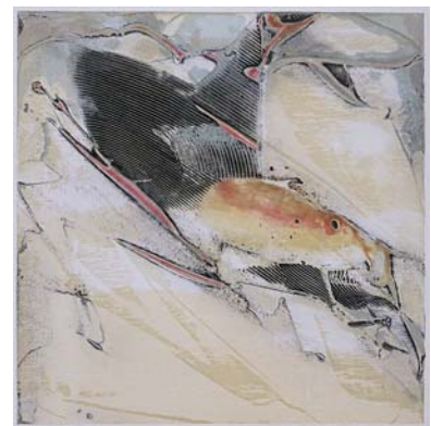
Richard Lacroix , Carpitude , 1990, estampe, collagraphie

Un an plus tard, devant le succès retentissant de la Collection, un espace d'exposition permanent est créé. Aux bijoux, on procure maintenant un écrin. La Galerie Loto-Québec est inaugurée. Alors qu'elle tient sa première exposition, la Collection acquiert sa 500 e œuvre, un pastel de Louis Muhlstock. Cette passion pour les arts se transmet aux employés de Loto-Québec. Le Service des ressources humaines, en collaboration avec le Musée des beaux-arts du Québec, conçoit le Concours de sculptures des retraités et gratifie son premier lauréat, l'artiste Dominique Valade.