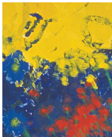
Gilles Carle, Les pavots de l'île (détail) , 2004, acrylique sur toile