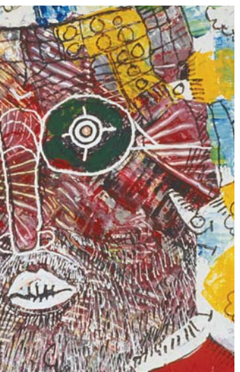
Gilles Carle, Autportrait (détail) , 1997, médiums mixtes sur toile