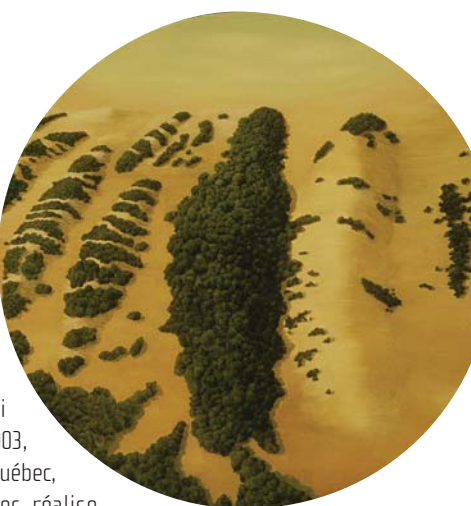
Judith Berry , Brazill , 1998, huile sur toile

Sans contredit, la Collection Loto-Québec est devenue un modèle incontournable pour les entreprises possédant une collection. Elle a su se distinguer par sa qualité et son excellence. En 2002, elle reçoit le prix Arts et Affaires de la Ville de Montréal, un témoignage éloquent qui confirme la reconnaissance que lui voue la collectivité québécoise.