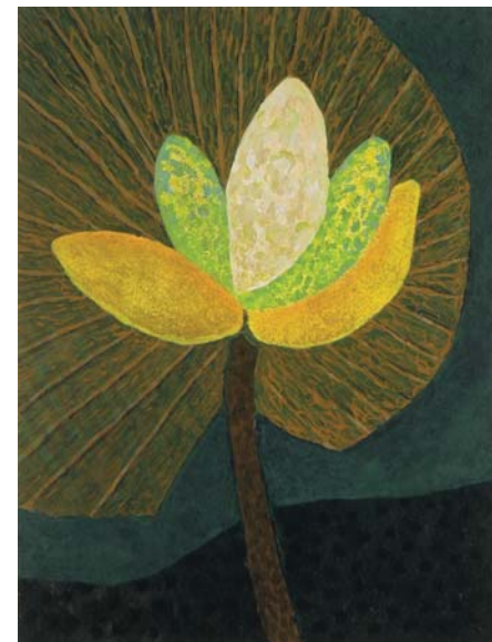
Caroline Bussièrès , Fleur d'eau , 2001, acrylique et collage sur papier