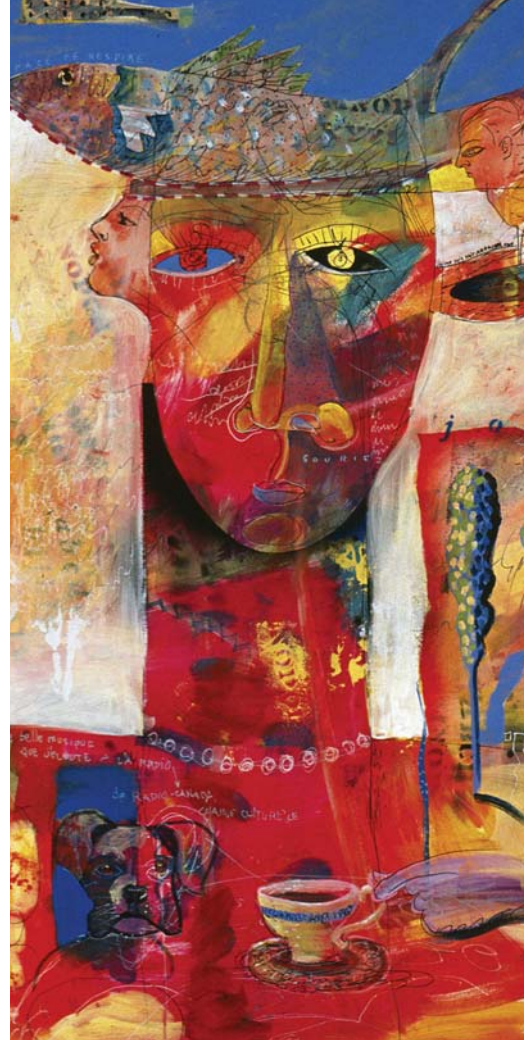
Claude Gauthier , Espace de respire (détail) , 2003, médiums mixtes sur toile