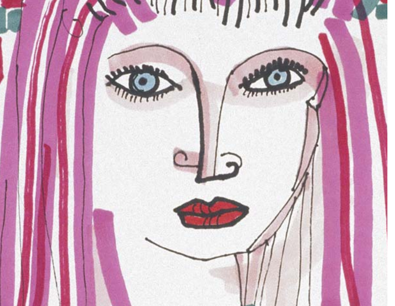
Gilles Carle, Chloé par Carle (détail) , 1997, crayon sur papier

À l'Office national du film, une institution qui favorise l'expérimentation et la recherche, Gilles Carle devient scénariste et réalisateur de documentaires s'inscrivant dans l'esprit du cinéma direct, qu'il délaisse toutefois pour la réalisation de sa première œuvre marquante, le long-métrage La Vie heureuse de Léopold Z. Avec ce film, qui obtient le Grand prix du cinéma canadien en 1965 et s'attire les louanges de Roberto Rossellini, Carle impose sa vision du cinéma d'auteur. Il quitte bientôt l'O.N.F. pour rejoindre d'autres cinéastes, tous partenaires d'une maison de production, Onyx films. Les longs métrages de ces cinéastes seront financés principalement par des productions télévisuelles, des publicités et des documentaires promotionnels et gouvernementaux. Les films de Carle produits par Onyx seront Le Viol d'une jeune fille douce , Red et Les Mâles .