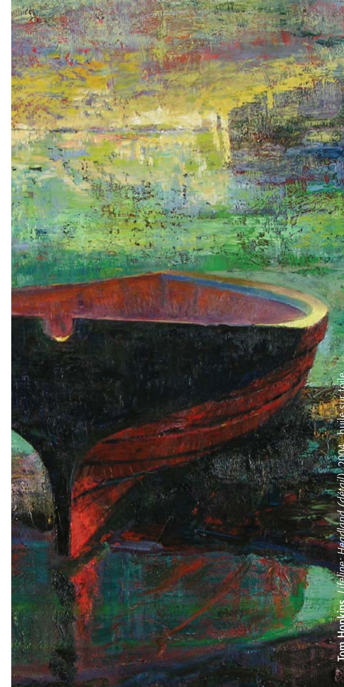
Tom Hopkins, Headland (détail) , 2004, huile sur toile