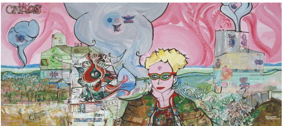
Gilles Carle, La gardienne du chaos , 1997, médiums mixtes sur toile