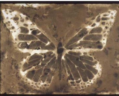
François Chevalier , Papillon du goudron , no 2, 2002, goudron sur papier

Un an plus tard, devant le succès retentissant de la Collection, un espace d'exposition permanent est créé. Aux bijoux, on procure maintenant un écrin. La Galerie Loto-Québec est inaugurée. Alors qu'elle tient sa première exposition, la Collection acquiert sa 500 e œuvre, un pastel de Louis Muhlstock. Cette passion pour les arts se transmet aux employés de Loto-Québec. Le Service des ressources humaines, en collaboration avec le Musée des beaux-arts du Québec, conçoit le Concours de sculptures des retraités et gratifie son premier lauréat, l'artiste Dominique Valade.